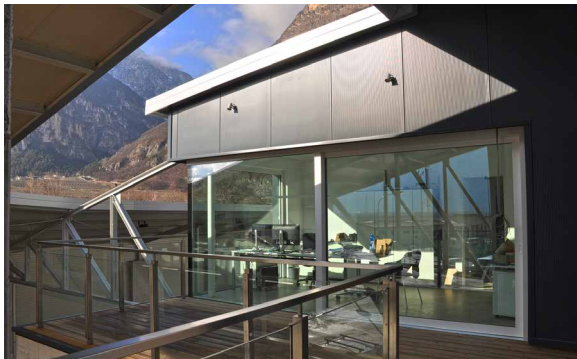
TISCHLEREI WALTER – ROVERE DELLA LUNA