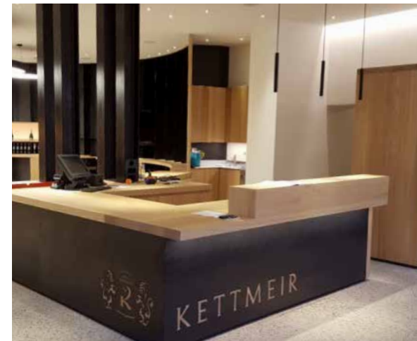
KELLEREI KETTMEIR – KALTERN