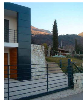
WOHNHAUS ZANETTI – KALTERN