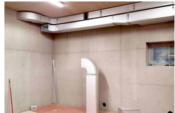
KELLEREI KETTMEIR – KALTERN