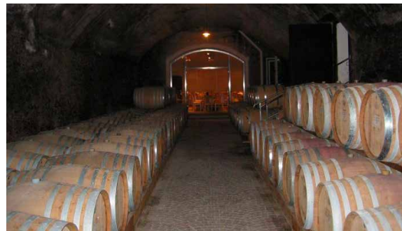
KELLEREI KETTMEIR – KALTERN