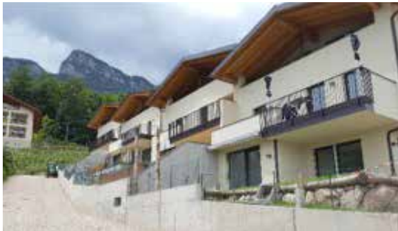
WOHNBAU ALTENBURG – KALTERN

Baumanagement & Sicherheitskoordinierung für die Errichtung von 4 Wohnhäusern (Baukosten rund 2,1 Mio. Euro). Baubeginn Januar 2017, Bauende April 2018.