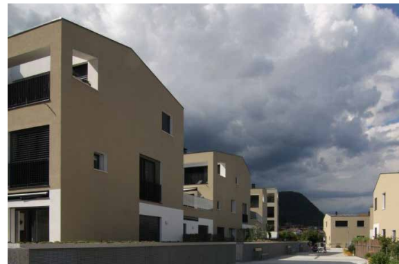
WOHNBAUGENOSSENSCHAFT GARTENWEG – KALTERN