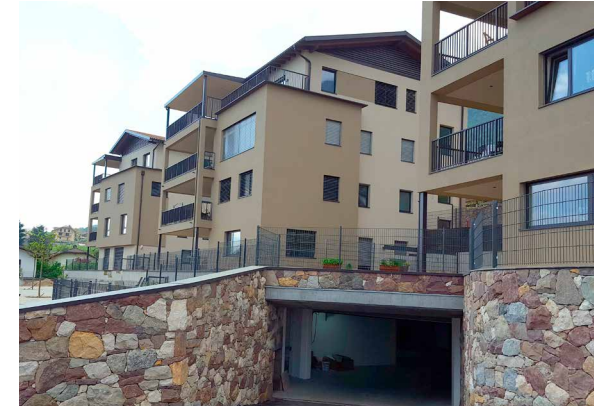
WOHNBAUGENOSSENSCHAFT ST. ANTON – KALTERN