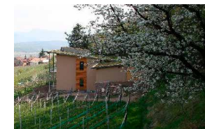
KREUZSTEINHÖFL – EPPAN