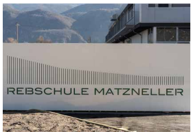
REBSCHULE MATZNER – KALTERN