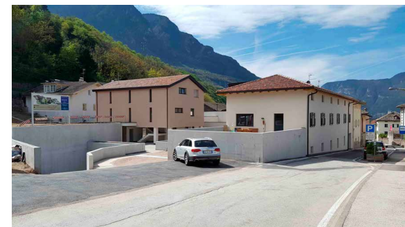
WOHNANLAGE SEIDENSPINNEREI – NEUMARKT