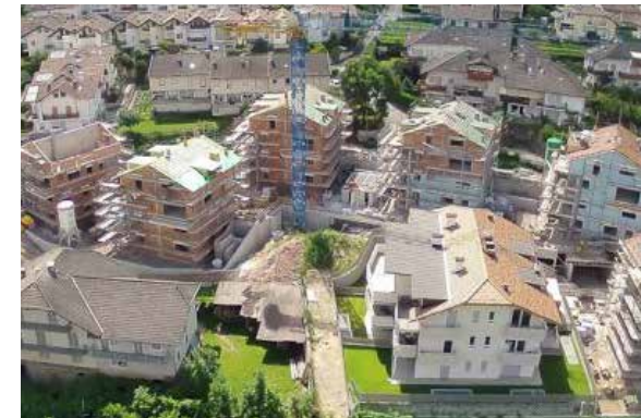
WOHNBAUGENOSSENSCHAFT BARLEIT – KALTERN